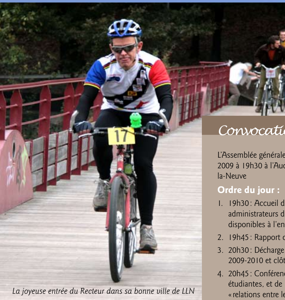
La joyeuse entrée du Recteur dans sa bonne ville de LLN