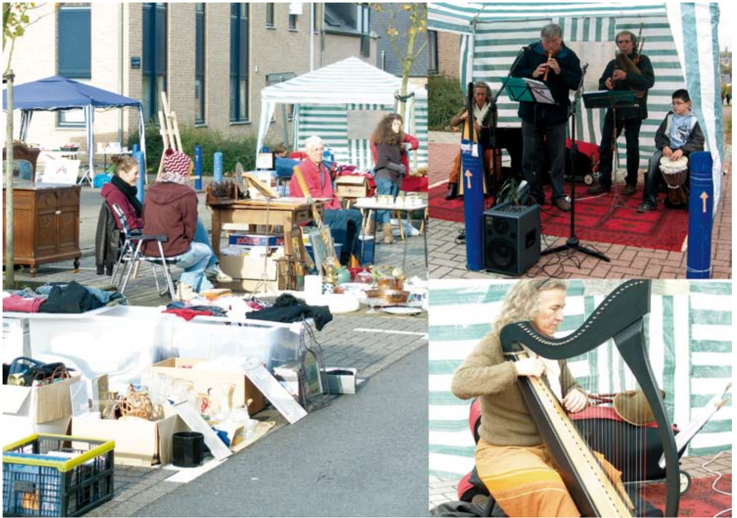
les Bruyères enchantées